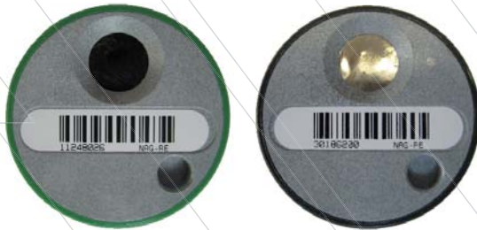
Figuur 1: Links de (groene) fotonendosimeter en rechts de (grijze) bèta/fotonendosimeter.

De door NRG-RE verstrekte dosimeter is een zogenoemde thermoluminescentiedosimeter of kortweg TLD. Deze dosimeter bevat 2 of 3 TL-detectoren. In de groene dosimeter (figuur 1, links), die geschikt is voor meting van doses fotonenstraling (röntgen- en/of gammastraling), worden twee met magnesium en titanium gedoopte lithiumfluoride (LiF:Mg,Ti) detectoren gebruikt (afmetingen: 3,2 x 3,2 x 0,9 mm). De één meet de oppervlaktedosis, H_p(0,07) , de ander de dieptedosis, H_p(10) . De grijze dosimeter (figuur 1, rechts), die geschikt is voor het meten van zowel fotonen- als bètastraling, bevat een derde dunne LiF:Mg,Ti-detector geplaatst achter een zeer dun lichtdicht folie. Om de detectoren te beschermen tegen licht, vuil en water is de dosimeter in een stijf gesloten doosje geplaatst. Figuur 2 en de detailtekening van figuur 4 bieden een blik in het inwendige.