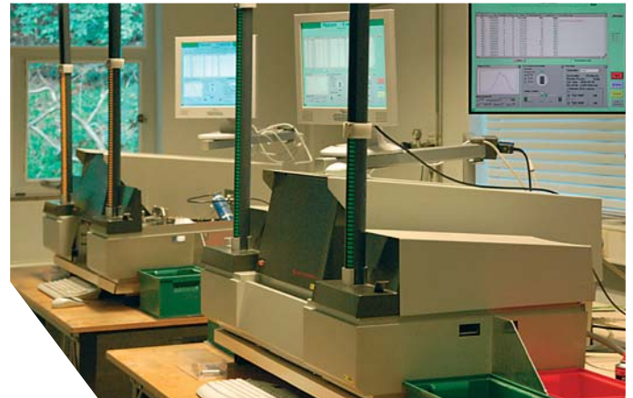
Figuur 3: TLD uitleesapparaat. De inzet in de rechterbovenhoek toont een scherm met gloeicurve.

hun oorspronkelijke niveau. De opgeslagen energie komt daarbij vrij als licht (thermoluminescentie). De hoeveelheid licht die tijdens de verhitting wordt uitgezonden door de detector wordt gemeten en is recht evenredig met de geabsorbeerde dosis ioniserende straling. Na deze verhitting in het uitleesapparaat (figuur 3) is de TLD weer in zijn oorspronkelijke staat teruggekeerd en kan opnieuw worden gebruikt.